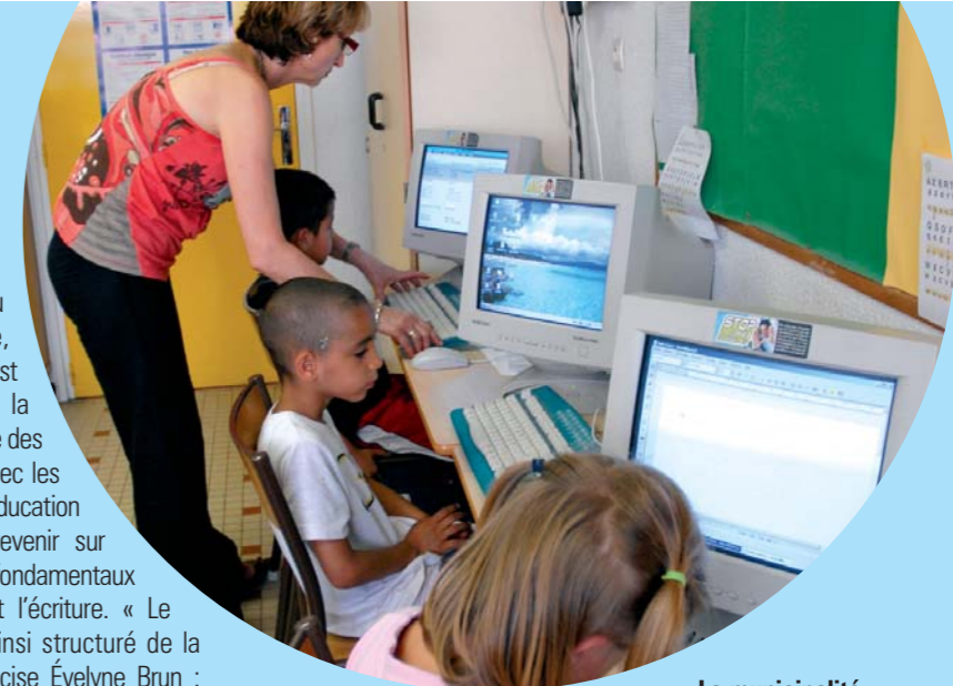
La municipalité investit dans les écoles cannoises

des loisirs... souligne Thierry Migoule. Quand les enfants, vers douze ans, ne savent plus s'ils sont grands ou petits. De plus, au niveau logistique, il n'est pas facile pour une famille avec plusieurs enfants d'en