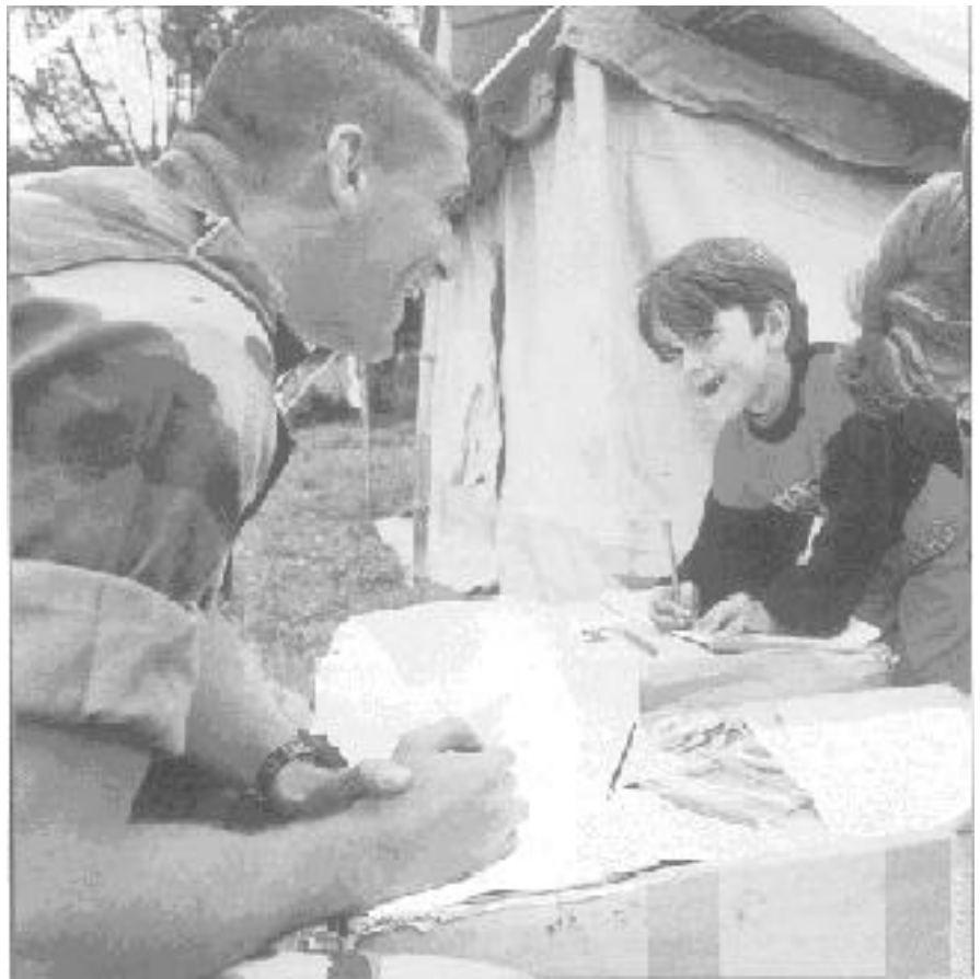
Faire prendre corps à « l'esprit humanitaire »

La prise en considération des blessés ou du sort des populations civiles est une préoccupation intrinsèquement liée à l'histoire de la guerre.