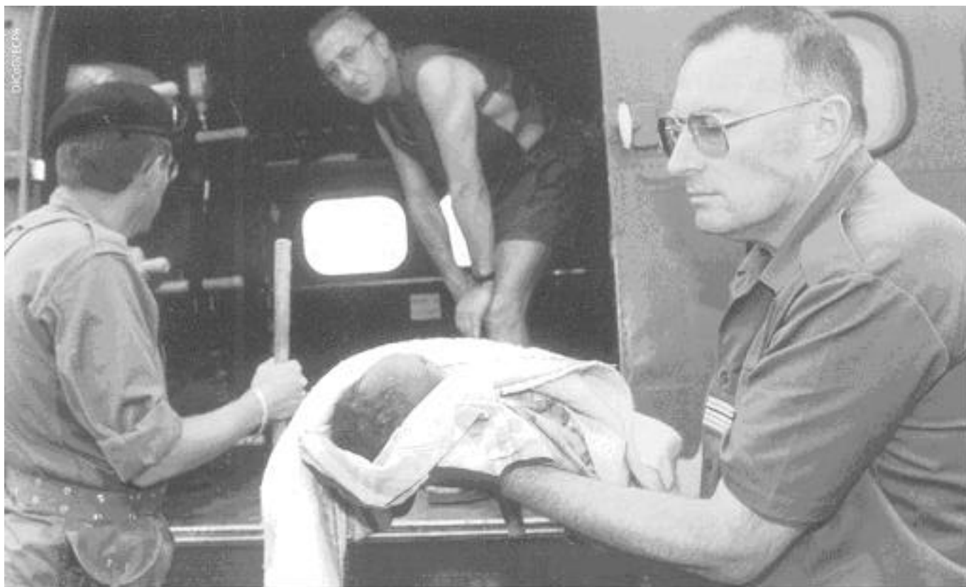
Les personnels de santé jouissent d'une protection spécifique dans l'exercice de leur fonction.

Parallèlement à ces avancées du droit, le renouveau de l'action humanitaire, sur le terrain, est consacré par l'arrivée des organisations humanitaires dites de seconde génération telles Médecins sans frontières, qui ne considèrent pas comme un préalable nécessaire à leur action (et c'est là la principale divergence avec les organisations de la Croix Rouge), l'accord de l'Etat sur le territoire duquel se déroule un conflit armé, mais qui vont rappeler toute l'importance qui s'attache au respect des normes fondamentales du droit international humanitaire.