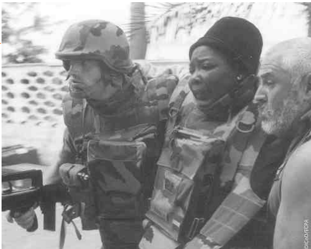
Protéger les personnes mises hors de combat et celles qui ne participent pas directement aux hostilités.

En second lieu, l'essor de la justice pénale internationale, qui vient compléter le rôle des juridictions nationales des États, déjà compétentes pour sanctionner d'éventuelles violations du droit international humanitaire, renforce la nécessité pour tout citoyen, y compris les membres des forces armées des États, de connaître les règles du droit international humanitaire.